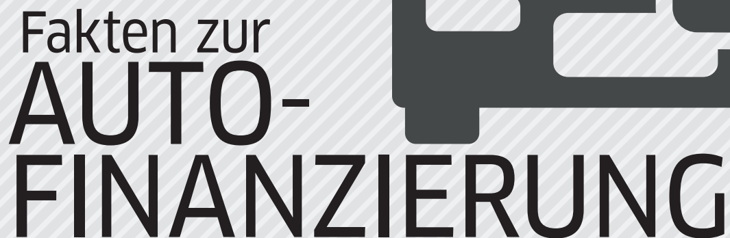
Finanzierung von Gebrauchtwagen (Privatkunden)